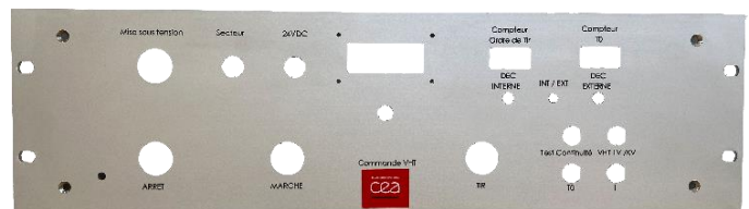
Usinage sur face-avant schroff + sérigraphie

ETIQUETTES – FACADES DE PUPITRE – PLASTRONS – FACES-AVANT – FACES ARRIERE – MARQUAGE INDUSTRIEL ELECTRONIQUE – AERONAUTIQUE – ARMEMENT - MEDICAL – INSTRUMENTATION – MACHINES INDUSTRIELLES