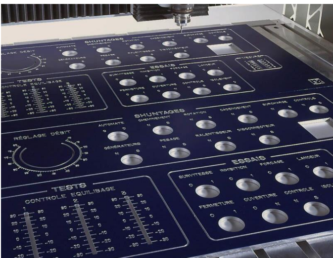
Usinage + gravure sur Aluminium anodisé noir